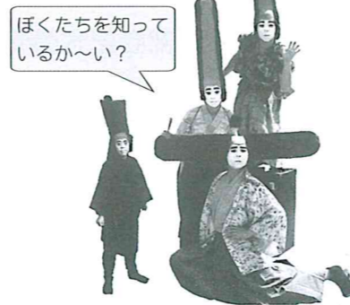
大道芸: おじゃるぞ