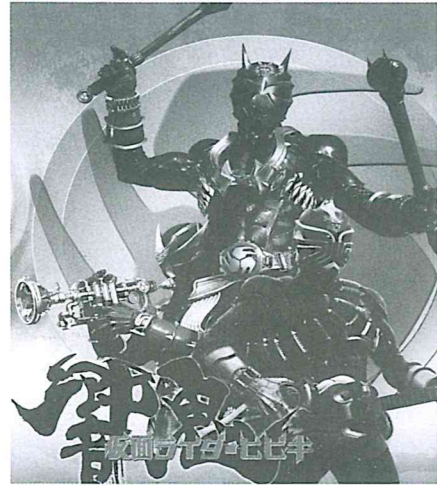
仮面ライダー響鬼ショー &サイン会

特産品展示販売・観光PR・産業製品展示 商工会員店、模擬店、キャラクターショー お楽しみ抽選会 午後12時45分より 抽選 午前10時15分より抽選番号券を先着1000名様に受付にて配布 甲州ハケ嶺太鼓・よさこい踊り