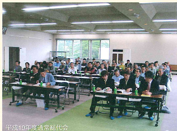
平成19年度通常総代会