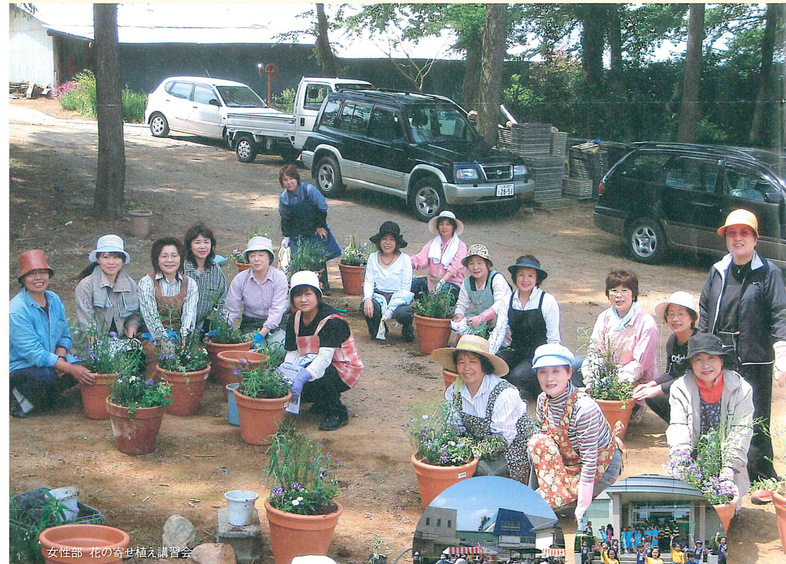
女性部 花の寄せ植え講習会

*輸血用血液には有効期限があります。 *献血が使われない日はありません。 *健康な皆様の献血が毎日必要です。