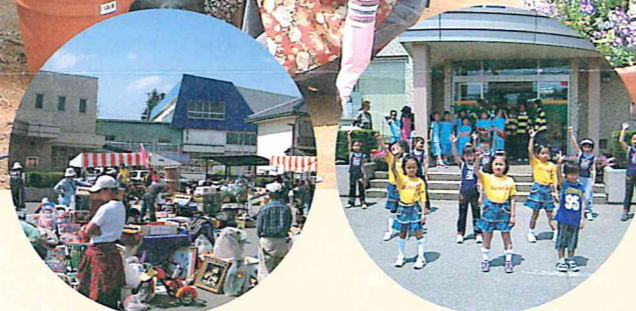
北の杜まつり(長坂)