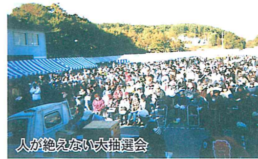
人が絶えない大抽選会

地域商工業の活性化及び商工会員相互の親睦と地域住民とのふれあいを目的に、「第2回北杜商工元気まつり」が平成18年11月12日(日)にJR長坂駅西広場で開催され、総勢約2,000人の来場者で賑いました。