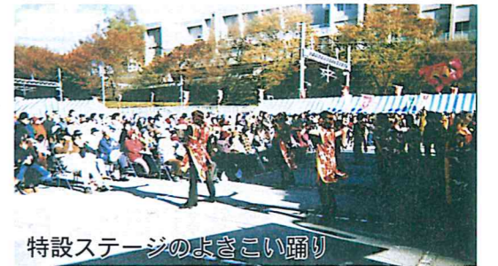
特設ステージのよさこい踊り

また、大抽選会でも人気賞品が人を呼び、最後まで人が絶えることがありませんでした。