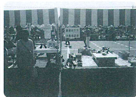
高根地区会・大泉地区会