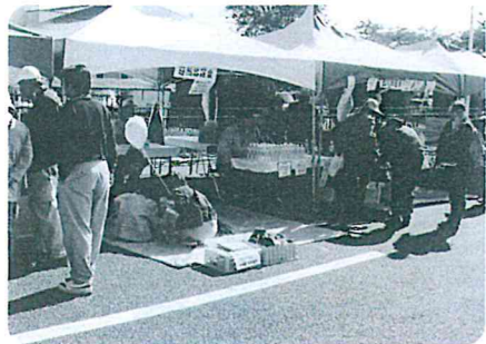
武川地区会・白州地区会