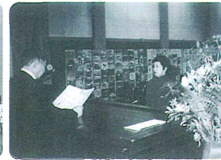
永年勤続優良従業員表彰式