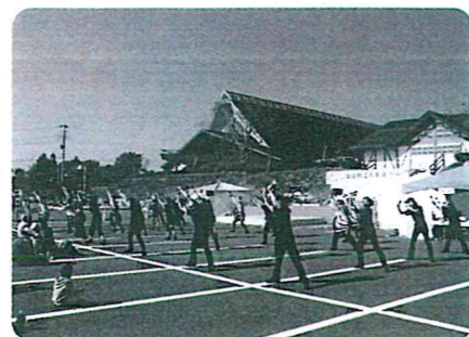
よさこいソーラン