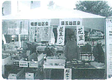
須玉地区会・明野地区会