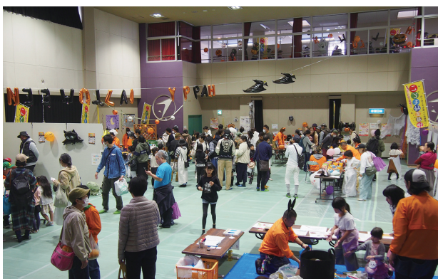
こども秘密基地会場

当日は、天候に恵まれ約2000人が来場。会場には飲食ブース、物販ブース、無料の体験・展示・相談ブースに32店が出店しました。建設工業部会は「高所作業車乗車体験」を実施し、子どもたちに建設業の魅力をアピール。青年部・女性部合同の「こども秘密基地」には10の体験コーナーを設けました。YOU優スタンプカード会では人気のズワイガニや全国の駅弁を販売。ステージショーでは吹奏楽団、ふるさと太鼓、アカバラユニット、よさこい演舞、チアダンスなどで会場を盛り上げていただきました。賞品総額200万円相当の大抽選会も好評で、子どもから大人まで終日楽しんでいただきました。