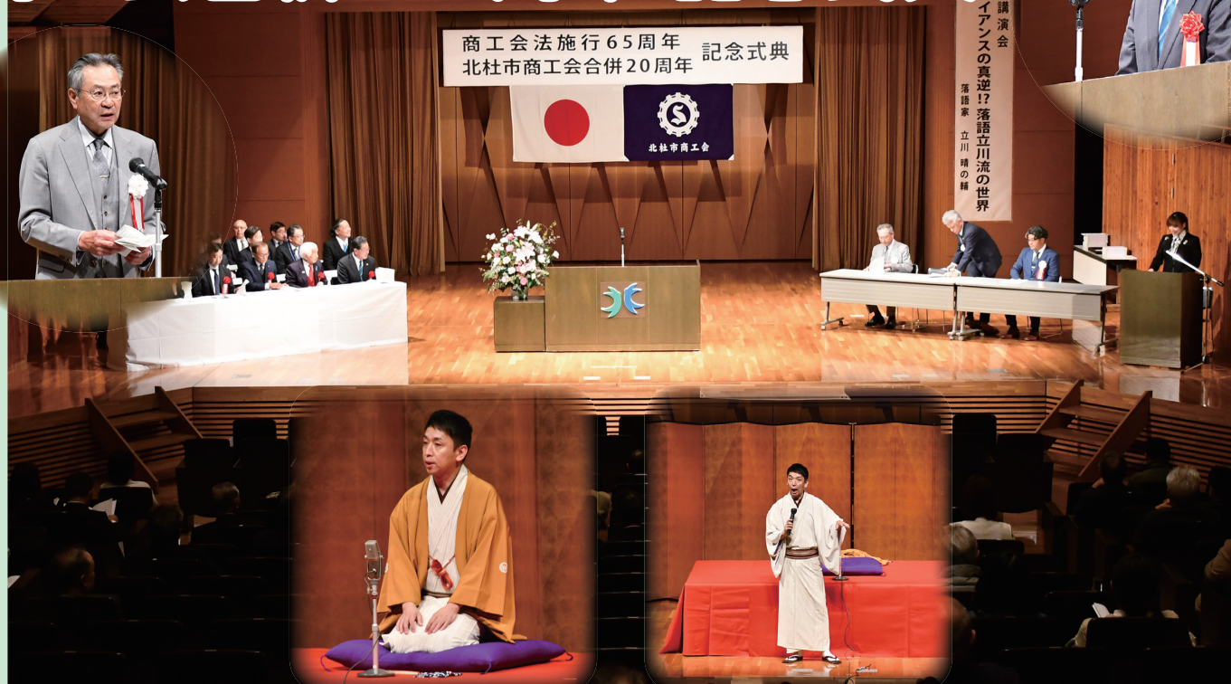
記念講演では笑点でおなじみの落語家 立川晴の輔氏にご講演いただきました。

本年度は、商工会法が施行され65周年、また合併により北杜市商工会が誕生して20周年の節目の年にあたります。