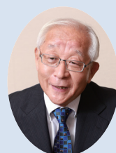
政治評論家 田崎史郎氏